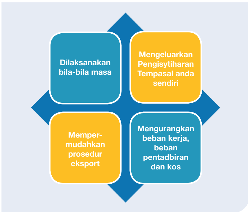
Rajah 1. Ringkasan Faedah AWSC

mungkin membebankan terutama bagi mereka yang berada di tempat yang jauh dari pejabat pihak berkuasa. Selain daripada penurunan yang signifikan dalam kos permohonan, AWSC juga mengurangkan masa untuk memproses pengiriman, yang mungkin berkaitan dengan penyimpanan, demuraj dan fi penahanan. Secara keseluruhan, CE digalakkan untuk berdagang dengan lebih cekap, memperoleh lebih banyak keuntungan dan menjana lebih banyak pekerjaan.